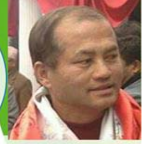
राजकुमार नकर्मी मेयर को उम्मेदवार