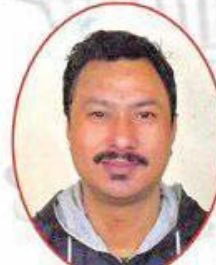
श्री प्रशान्त महासागर नकमी वडा नं. ९ का सदस्य उम्मेदवार