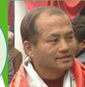
राजकुमार नकर्मी मेयर को उम्मेदवार