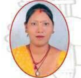
श्री कमला पट्टवार बडा नं. ४ का महिला सदस्य उम्मेदवार