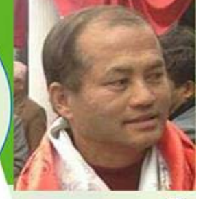
राजकुमार नकर्म मेयर को उम्मेदवार