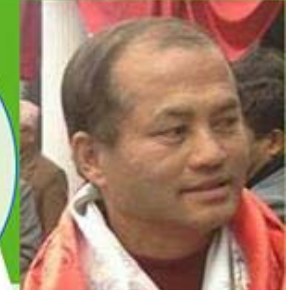
राजकुमार नकर्म मेयर को उम्मेदवार