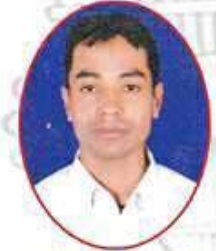
श्री नरेन्द्र सङ्की बडा नं. ५ का सदस्य उम्मेदवार