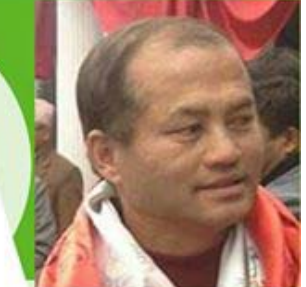
राजकुमार नकमी मेयर को उम्मेदवार