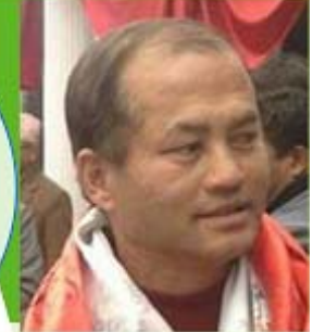
राजकुमार नकमी मेयर को उम्मेदवार

अहिले नेपालमा वार्षिक भन्डै ८ लाख पर्यटक आउछन् । ति मध्य करीब ७५% अर्थात करीब छ लाख हवाई मार्ग बाट अर्थात काठमाडौंमा आउछन् ।