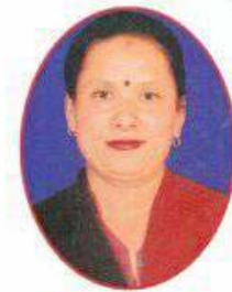
श्री पार्वती महर्जन वडा नं. ९ का महिला सदस्य उम्मेदवार